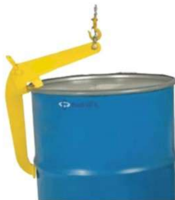
Рисунок 2. Работа захвата